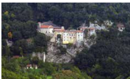
Alcuni volontari con due frati francescani del Santuario di Greccio. L'eremo del XIII secolo, in mezzo di boschi, fotografato dal paese.

Greccio, nei fine settimana di dicembre e durante la solennità dell'Epifania è una conferma dell'impegno e della dedizione dei Volontari dell'Ordine di Malta verso il prossimo.