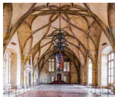
Castello di Praga.