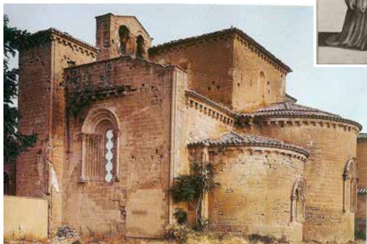
Qui sotto, due foto dell'imponente Monastero delle Suore melitensi di Sijena, fatto costruire nel XII secolo dalla Regina Sancha d'Aragona (al centro, in un disegno dell'epoca).