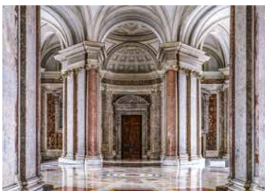
Reggia di Caserta.