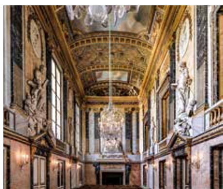
Opera Reale di Versailles.